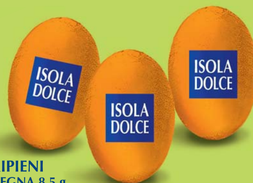
OVETTI FONDENTI RIPIENI CREMA AL PASSITO DI SARDEGNA 8,5 g 10 BUSTE DA 500 g COD. ART. 6503