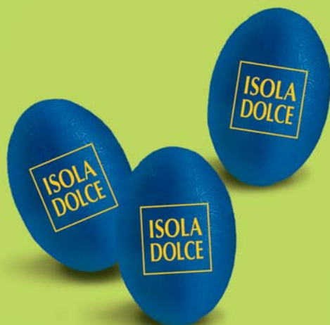
OVETTI FONDENTI RIPIENI CREMA AL MIRTO DI SARDEGNA 8,5 g 10 BUSTE DA 500 g COD. ART. 6502