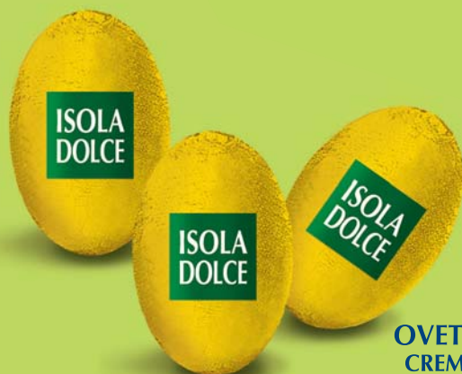
OVETTI FONDENTI RIPIENI CREMA AL LEMONCELLO 8,5 g 10 BUSTE DA 500 g COD. ART. 6504