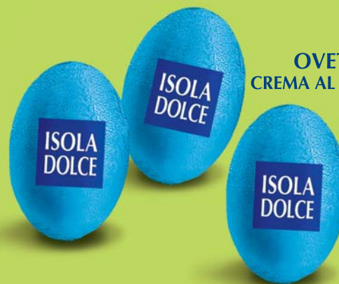
OVETTI FONDENTI RIPIENI CREMA AL FILU FERRU DI SARDEGNA 8,5 g 10 BUSTE DA 500 g COD. ART. 6505